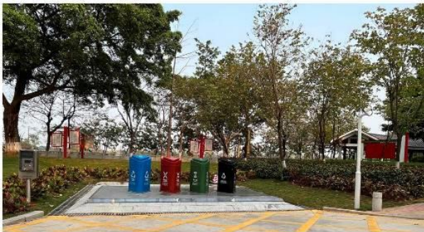
普慧地理式（升降式）垃圾分类投放站总成

型号: PH-CJ4-1100-V1 规格: 4×1100L 尺寸: 5.2×2.1×1.5m 功率: 2.2KW